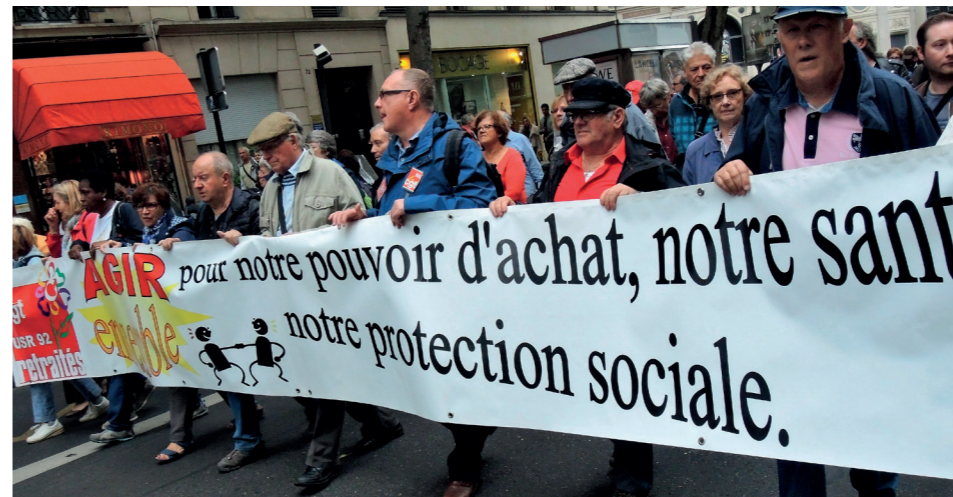
Manifestation des retraité.e.s à Paris le 28 septembre 2017.

On le sait , en 1945, est instauré le régime général de la Sécurité Sociale pour tous les salariés du privé : le salaire des actifs sert immédiatement à payer les pensions de retraites, à faire face à la maladie, la maternité ou l'accident. C'est le système par répartition : "Chacun cotise selon ses moyens et reçoit selon ses besoins." Certains disent qu'elle est "un avant-goût de socialisme imposé à l'intérieur du capitalisme".