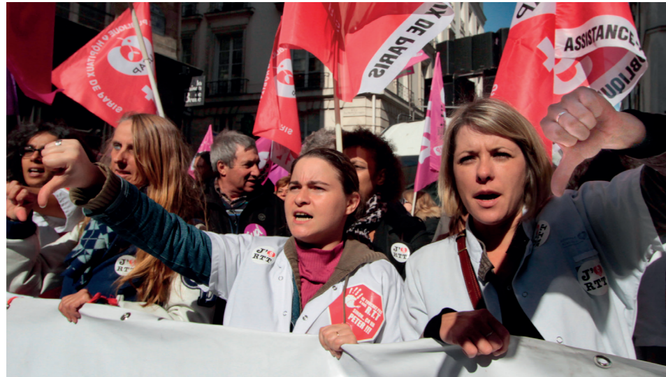
Manifestation nationale du secteur Santé-Sécu-Social, 7 mars 2017 Paris.

soignants qu'il faut en nombre suffisant. A la blanchisserie par exemple, les conditions de travail sont difficiles, très fatigantes, dans le bruit, la chaleur et la vapeur des produits nettoyants. En cas d'arrêt maladie, les répercussions sont immédiates sur les autres services, qui, du coup, n'ont pas assez de linge.